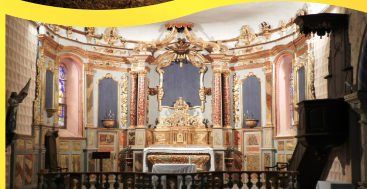
retable classé du XVIIIème siècle